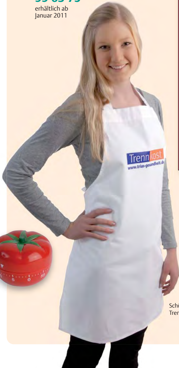
Schürze mit Trennkost-Aufdruck