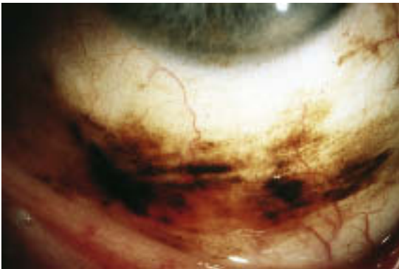
c Melanosis conjunctivae (primär erworbene Melanose).