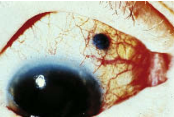
f Malignes Melanom des Ziliarkörpers mit Durchbruch unter die Bindehaut.