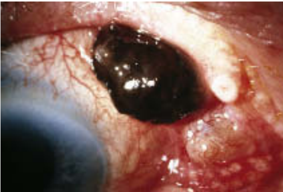
e Malignes Melanom der Bindehaut.