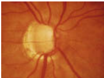
Glaukom: Stadium III