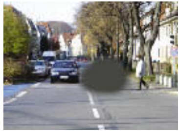
Fibröse Netzhautnarbe aufgrund von altersbezogener Makuladegeneration (AMD)