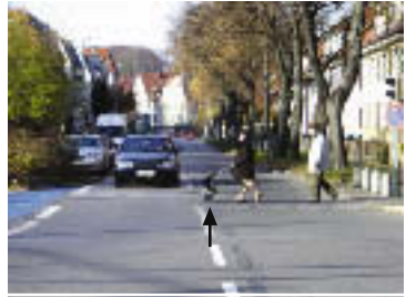
Exsudative, altersbezogene Makuladegeneration (AMD) – Verzerrung in der Bildmitte (Pfeil)