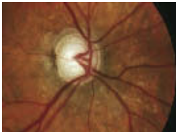
Glaukom: Stadium IV; vgl. S. 240f.