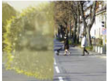
Migräne mit Aura: links Gesichtsfeldausfall bei Beginn, rechts bei Vollbild