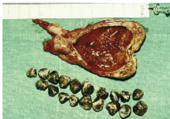
Gallensteine, die zu einer chronischen Gallenblasenentzündung geführt haben