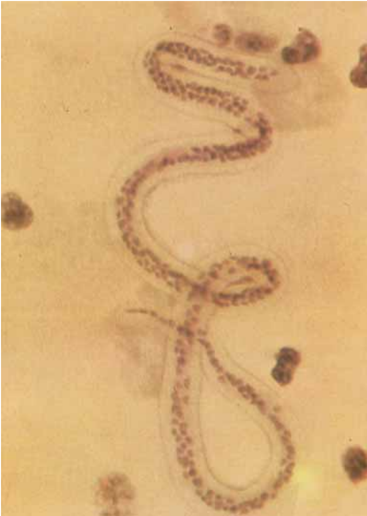
Abb. 12.7 Mikrofilarie einer Wuchereria bancrofti im Blut ( Mikrofilaria nocturna ). Zu ihrem Nachweis ist eine nächtliche Blutentnahme notwendig.