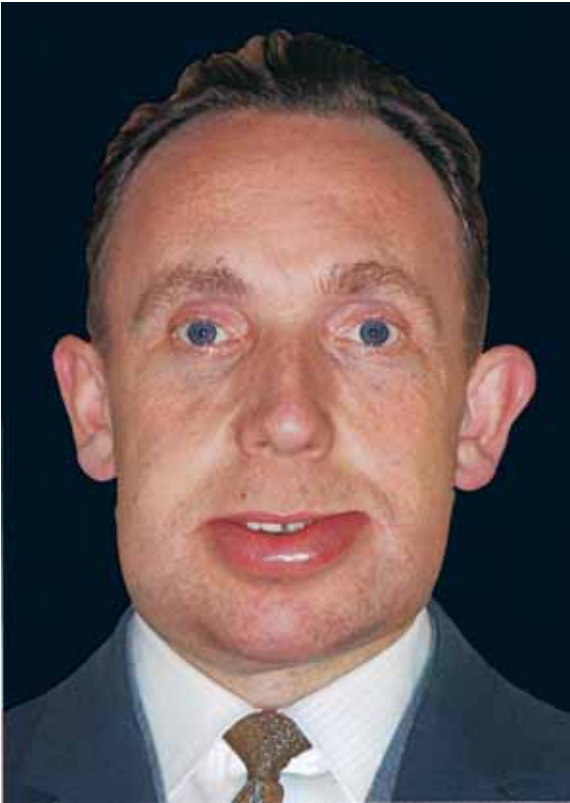
Abb. 12.8 Quincke-Ödem der Unterlippe.

cata). Das Angiödem der oberen Luftwege kann zu einer lebensgefährlichen Kompression der Glottis führen. Die intestinale Beteiligung geht mit Koliken und Erbrechen einher.