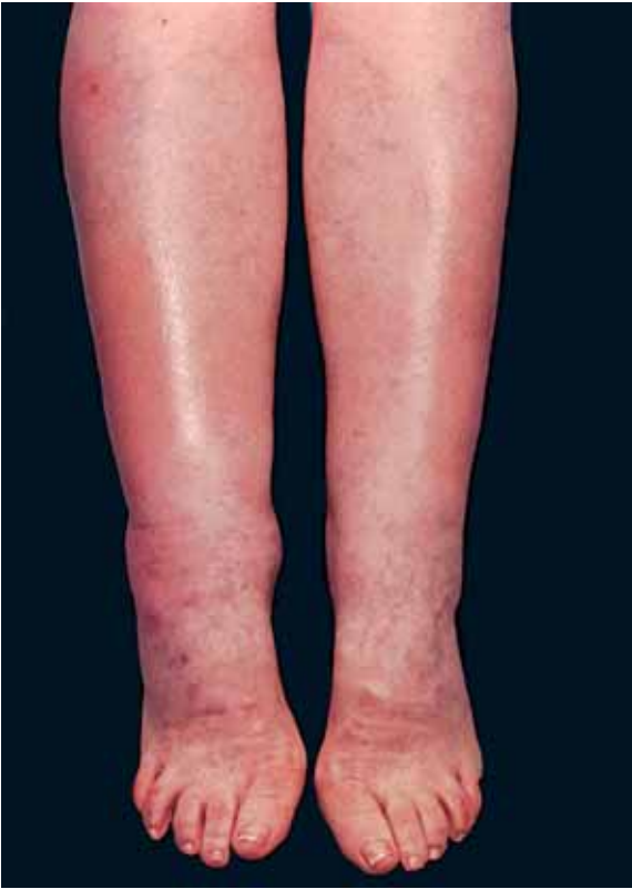
Abb. 12.3 Prätibiales Myxödem bei Patientin mit Hypothyreose.

nostisch wegweisend ist die Bestimmung von \alpha_1 -Antitrypsin in Serum und Stuhl (physiologischer Verlust < 2,6 mg/g Stuhlgewicht) oder die aufwändigere quantitative Bestimmung der fäkalen Ausscheidung von intravenös verabreichten radioaktiv markierten Makromolekülen (z. B. ^{51}\text{Cr} -Albumin). Als Ursache für eine exsudative Gastroenteropathie kommen endoskopisch oder radiologisch leicht fassbare Erkrankungen wie z. B. die Colitis ulcerosa, Polyposen, die hypertrophe Gastropathie (Ménétrier-Syndrom) oder die idiopathische Sprue in Frage (s. Kapitel 27 und 28). Nur bei Störungen des intestinalen Lymphabflusses kann die Diagnose eines enteralen Eiweißverlustes Schwierigkeiten bereiten und einen ^{51}\text{Cr} -Albumin-Test und/oder eine Lymphographie erfordern. Bei der angeborenen intestinalen Lymphangiektase, die sich zum Teil erst im frühen Erwachsenenalter manifestiert, kommt es wegen einer lymphatischen Klappeninsuffizienz zu einem Reflux der chylushaltigen Lymphe und zu Chylus-Darm-Fisteln. Sekundär kann sich ein chylöser Reflux bei erworbenen Abflussstörungen entwickeln, z. B. im Rahmen abdomineller Tumoren.