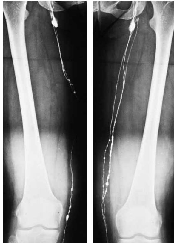
Abb. 12.5 Lymphographie mit wasserlöslichem Röntgenkontrastmittel bei Patientin mit doppelseitigem primärem Lymphödem. Anstelle von mindestens 8 Sammelrohren im Oberschenkelbereich stellen sich nur 1–2 dar (Hypoplasie).

Chylöses Lymphödem. Das chylöse Lymphödem stellt eine Sonderform dar. Reicht die Klappeninsuffizienz der Lymphgefäße bis zur Cisterna chyli, so kann die chylushaltige Lymphe aus dem Darm retrograd abfließen. Ein Lymphödem der Genitalien und der Beine kann die Folge sein. Vorwölbungen in der Leistenenge täuschen Hernien vor. Gelegentlich entleert sich milchige Lymphe aus oberflächlichen Bläschen (Lymphfisteln). Selten sammelt sich ein Chylaszites an. Beim sog. Syndrom der „gelben Nägel“ finden sich neben einem Lymphödem der Extremitäten Pleuraergüsse.