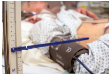
8 ..... .....