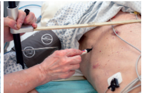
3 ..... .....