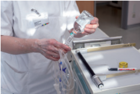
4 ..... .....