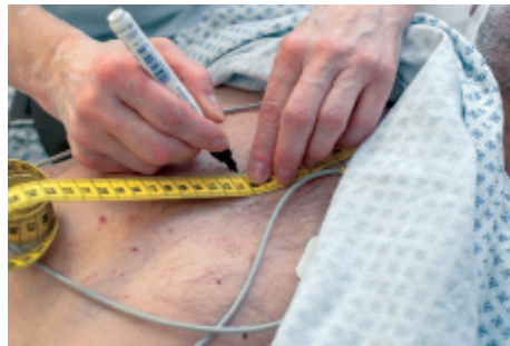
2 ..... .....