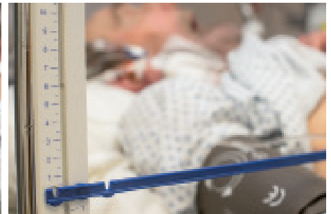
9 ..... .....