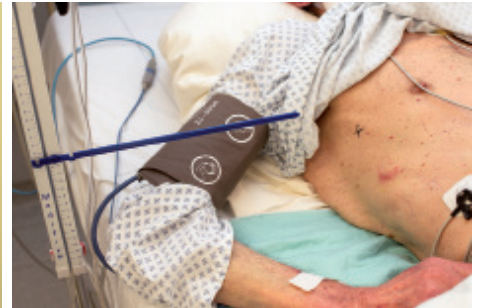
6 ..... .....