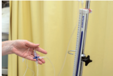
5 ..... .....