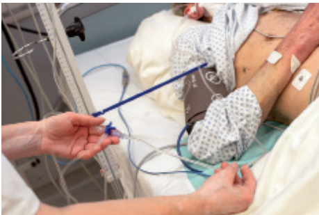
7 ..... .....