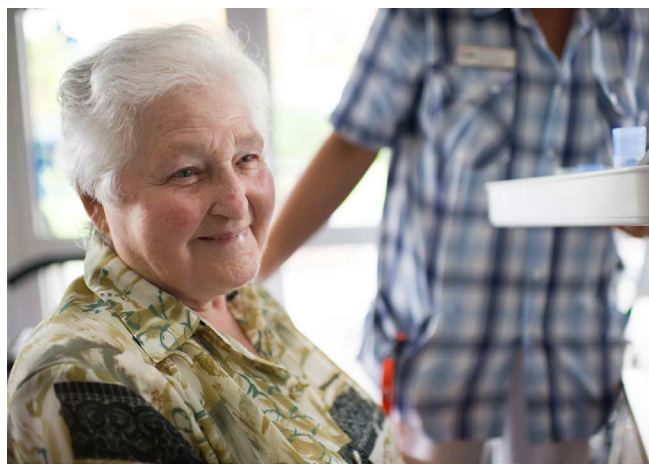
Oft fühlen sich besonders ältere Patienten vom Krankenhausaufenthalt überfordert. Die bekannte Umgebung des eigenen Zuhauses vermittelt Sicherheit.