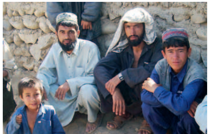
Zu den Patienten gehören nicht nur Soldaten, sondern überwiegend Einheimische.