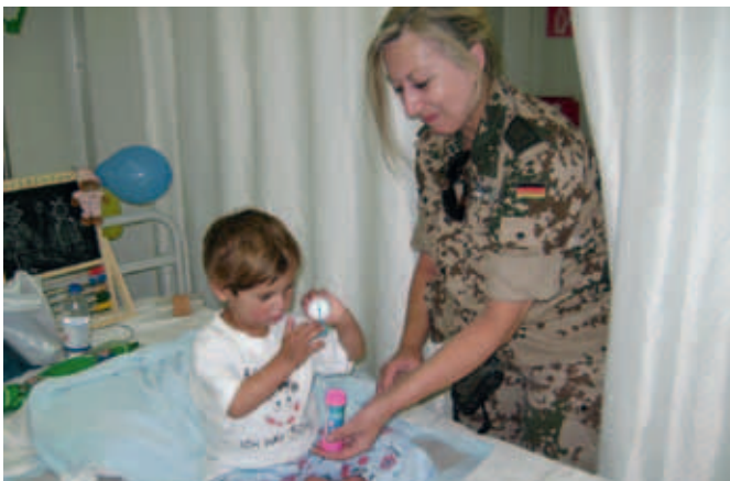
Ein dreijähriges Mädchen mit einer offenen Thorax-Verletzung, das ohne die deutsche Hilfe gestorben wäre.

„Das Instrumentarium und die Geräte im Einsatz sind sehr hochwertig und erlauben jegliche Versorgung, aber die Handhabung ist ein bisschen anders als bei den gewohnten Geräten in Deutschland. Im Einsatz werden andere Hochfrequenzchirurgie-Geräte für die Koagulation verwendet als in deutschen Krankenhäusern. Auch der Fixateur externe nach Stuhl-Heiser wurde in Deutschland schon durch modernere Methoden der Fixation abgelöst“, erläutert Zirngibl. Er sieht aber die Problematik nicht in der Bedienung der Geräte, sondern in der Ausbildung des Personals bzw. der standardisierten Arbeitsweise des Personals: „Wenn ich einen Raum betrete und weiß, der Lichtschalter ist auf der rechten Seite, habe ich kein Problem. Ist er aber plötzlich links, tappe ich im Dunkeln. Deshalb ist es erforderlich, dass man die-