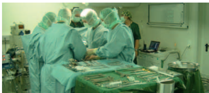
Alltag in einem Rettungszentrum aus festen Gebäuden in Feyzabad: Fast wie zu Hause, nur enger.

Zu den Patienten gehören aber nicht nur Soldaten, sondern überwiegend Einheimische. Diese Patienten kommen auf verschiedenen Wegen zu den Deutschen, zum Beispiel über eine kostenfreie Sprechstunde, die – wenn es die Lage zulässt – jeden Nachmittag stattfindet. So kann die OP-Gruppe humanitäre Hilfe leisten, mit den dortigen Bewohnern das wichtige Vertrauensverhältnis aufbauen und ihre eigenen medizinischen Fähigkeiten durch praktische Übung erhalten. Zirngibl hat auch schon erlebt, dass erkrankte Einheimische einfach vor dem Tor abgelegt werden. Es gibt aber auch Fälle, in denen inländische Ärzte die Deutschen zur